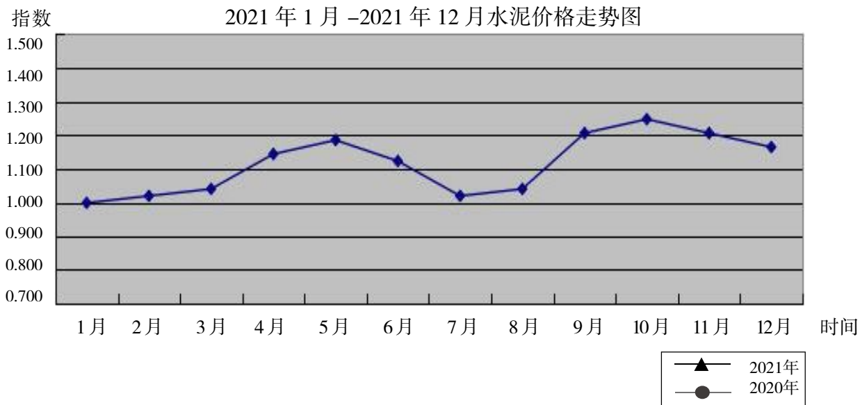
2021年1月-2021年12月水泥价格走势图